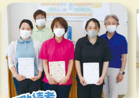
長期勤続者 記念品贈呈