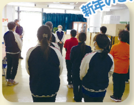
新年のごあいさつ