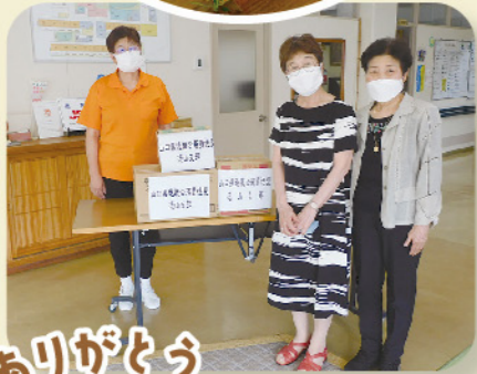
いつもありがとうございます ごぞいます