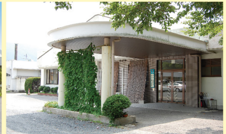
デイサービスセンター

猛暑の続く暑い夏を迎えています。皆様にはご健勝にてお過ごしのことと拝察いたします。新型コロナウイルス感染症は依然として収束に至りませんが、東京オリンピックは開催され、明るい話題も多くありました。 こうした中、苑ではワクチン接種を無事に終え、安心感があります。ものの、行事や面会等に関しては、今後も周辺や全国の感染者状況を勘案して適時対応して参りたいと考えておりますので、引き続きご理解の程お願いいたします。 さて、最近、様々な横文字を目にしますが、介護報酬改定の中でもCOVID-19やBCP、ICT、LIFEなどの用語が部分的に用いられ、その必要性が示されています。 このように、介護事業を巡る環境は日々変化しており、施設としてもこれらに柔軟に対応していくことが求められています。こうした中、最近、とくに耳にするSDGsについても、17項目の目標を意識しつつ、今年度の事業計画の達成を図っていくことも必要と考えています。 とは言え、ICT等の活用を推進することにあっても、やはり人の手のぬくもりを伝えることで、苑の伝統を守り、時代にも乗り遅れることがないように、職員一丸となって前進していくことが重要です。そして、関係する皆様とのご縁を大切に、今後も信頼を損なうことのないように地域の開かれた施設、皆様に愛される施設としての運営に努めて参ります。引き続きよろしくお願いいたします。