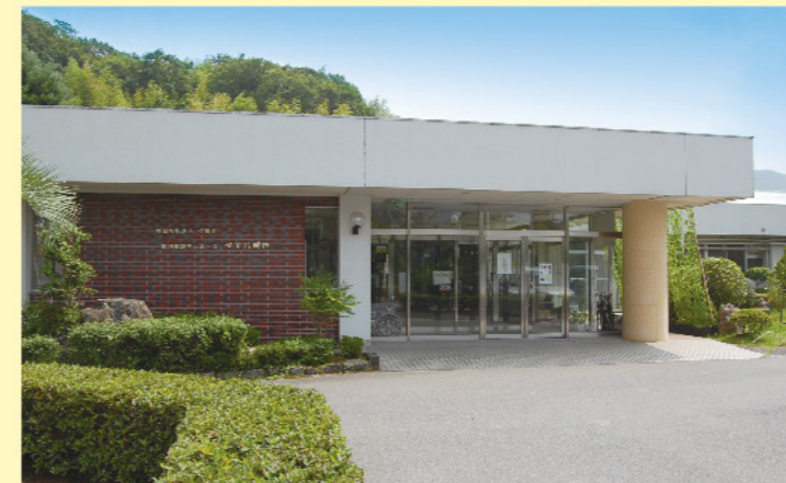
特別養護老人ホーム やすらぎ苑