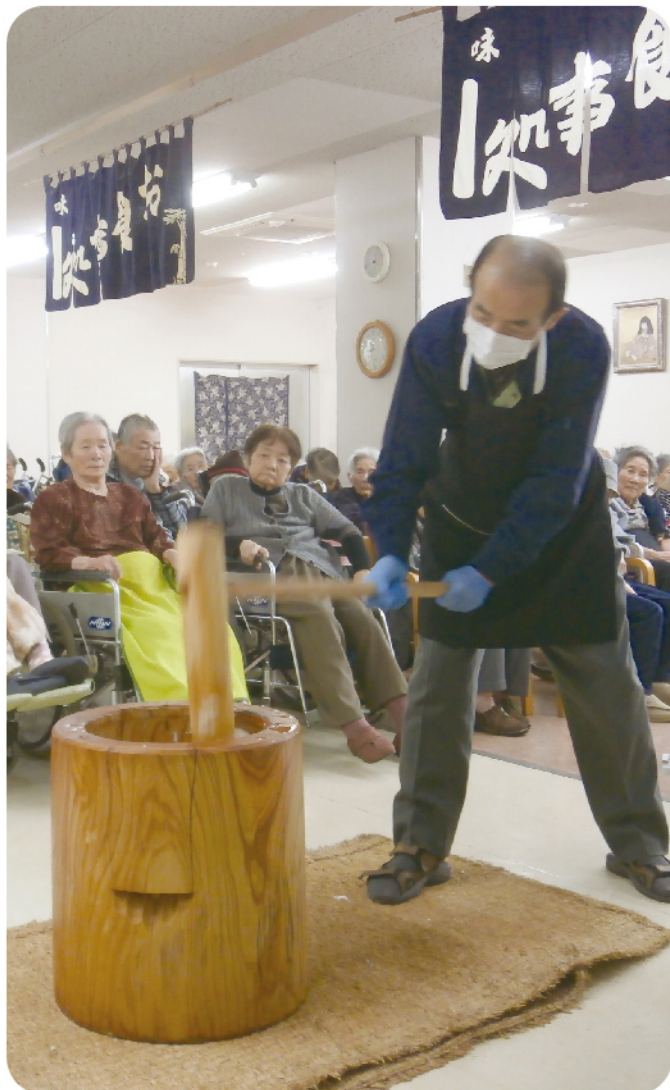
H28年12月28日 餅つき大会