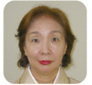
社会福祉法人仁泉会